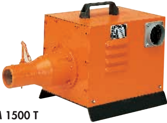
M 1500 T